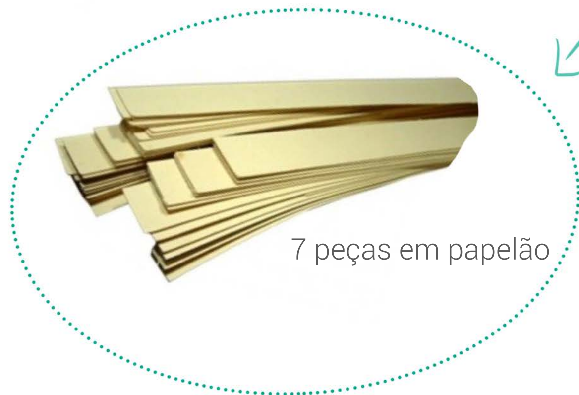
7 peças em papelão