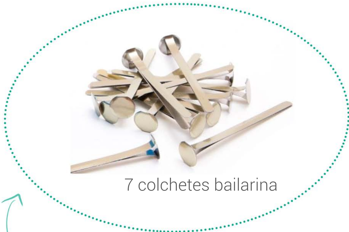
7 colchetes bailarina